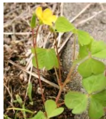
エゾタチカタバミ