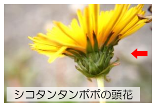
シコタンタンポポの頭花

年中、町中に咲いているものはセイヨウタンポポです。明治の初め、札幌農学校の外人教師が食用として北米から種子を持ち込み栽培したものが野生化しました。 年中何回も咲き、受精なしに種子を作ります。1本の花柄に1つの頭花(小さな花の集まり)が付く、頭花の側面に総苞片(先のとがったもの)が多数付く、下へ反り返る。 花は日光が当たる(温度の説明)と開き、日没とともに閉じる。在来のエゾタンポポの花は春だけで受精しないと種子ができません。 山間部の道端にひっそり咲いている。総苞片は下へ反り返らない。海岸や林縁には在来のシコタンポポが少しある。総苞片は反り返らず角があり、灯台近くにある。 3種とも大きさや形はほぼ同じです。