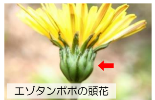
エゾタンポポの頭花