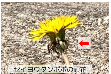
セイヨウタンポポの頭花

年中、町中に咲いているものはセイヨウタンポポです。明治の初め、札幌農学校の外人教師が食用として北米から種子を持ち込み栽培したものが野生化しました。 年中何回も咲き、受精なしに種子を作ります。1本の花柄に1つの頭花(小さな花の集まり)が付く、頭花の側面に総苞片(先のとがったもの)が多数付く、下へ反り返る。 花は日光が当たる(温度の説明)と開き、日没とともに閉じる。在来のエゾタンポポの花は春だけで受精しないと種子ができません。 山間部の道端にひっそり咲いている。総苞片は下へ反り返らない。海岸や林縁には在来のシコタンポポが少しある。総苞片は反り返らず角があり、灯台近くにある。 3種とも大きさや形はほぼ同じです。