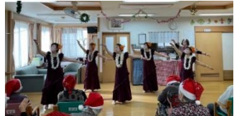
(ハイビスカス：及川)

12月25日、グループホームコスモスで行われたクリスマス会にお招きいただき、フラダンスを披露させていただきました。途中から職員の方も一緒に踊っていただいたものですから、入居者の皆さんは大喜び。その笑顔をみながら楽しく踊らせてもらいました。