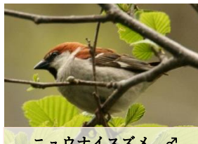
ニューナイスズメ ♂

スズメとは小さい鳥のこ とです。生垣などで集団を 見ます。 全長(嘴の先から尾の端 まで)14.5cm、体重25g(ほ どの留鳥。頬と喉に黒い模 様。歩くときは両足をそろ えて跳ねる。雌雄同色で、 交尾の時上が大体雄。 人家付近でのみ見られる。 タカ・ヘビなどの天敵を避 けるために人のそばが好き (人が好きなのではない)。 4月8月、ペアで2〜3 回繁殖。1日1個ずつ産卵 し、温めないで発生が進ま ない。 4月6日産み終えてから 12日で一斉に孵る。 巣立つた後10日ぐらい親 が子に餌を